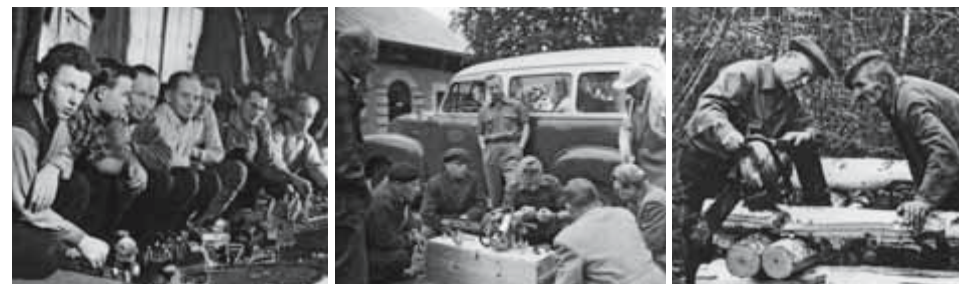
Mesäiltoin Viesti 1960.