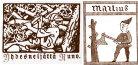
Akseli Gallén-Kallelän runonkupiirros vuoden 1922 Kuva-Kalevalassa sekä kuva vuonna 1399 julkaistusta ruotsalaisesta almanakasta. Maaliskuussa (Martius) hakattiin polttopuita.

Odysseuksen käyttämässä vaskisessa kirveessä oli varsi oliivipuusta, kaunisveistoinen, teränsilmään löyrynä tiukkaan.