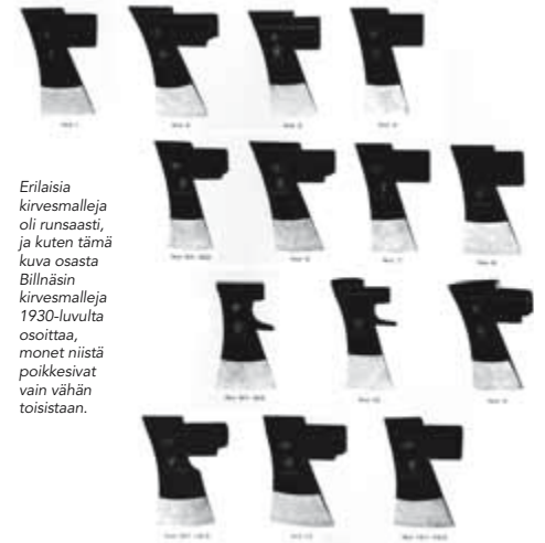
Erlaisia kirvesmalleja oli runsaasti, ja kuten tämä kuva osasta Billnäsin kirvesmalleja 1930-luvulta osoittaa, monet niistä poikkesivat vain vähän toisistaan.

E.M. Karrakoski on kuvaillut laajasti Vakka-Suomessa käytettyjä kirveitä, joita oli hyvinkin monta mallia. Hänen mukaansa kaatokirves on silmä-rakenteeltaan painava, mutta terä kapea, ohut ja hyvin ”knäkkisä” [vinosti vartta vasten]. Halkaisukirveessä on taas lapa pitkä, terä kiilamainen, te-