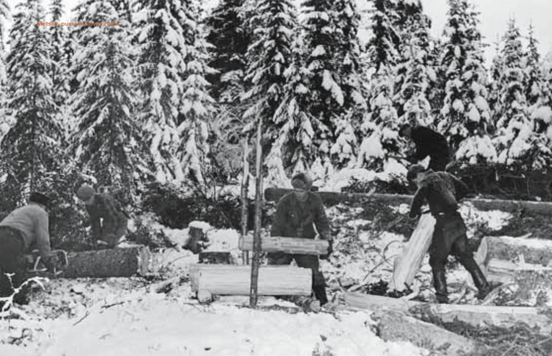
Moottorisahan ympärille saatiin koota myös isompi työporukka eli tiimi (mitä sanaa ei tuolloin kuitenkaan käytetty). Kuvassa viiden miehen tiimi Serlachuksen työmaalla talvella 1951; saha tosin on vielä niitä vanhempia kahden miehen sahoja.

– joutuessaan toimittamaan sahasa syystä tai toisesta korjaamolle – mahdollisuus saada myyjältään veloutukset lainasaha korjauksen ajaksi, Hyryläinen mainosti. ”Takuusta” huolimatta tästä uudemmastakaan Hyrystä ei tullut kovin kummoista myyntimenestystä.